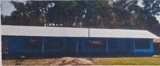
Foto 1: Se observa que la escuela es cambiado el techo en su totalidad.